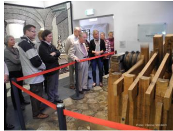
Text und Bilder: Heinz Wöllert