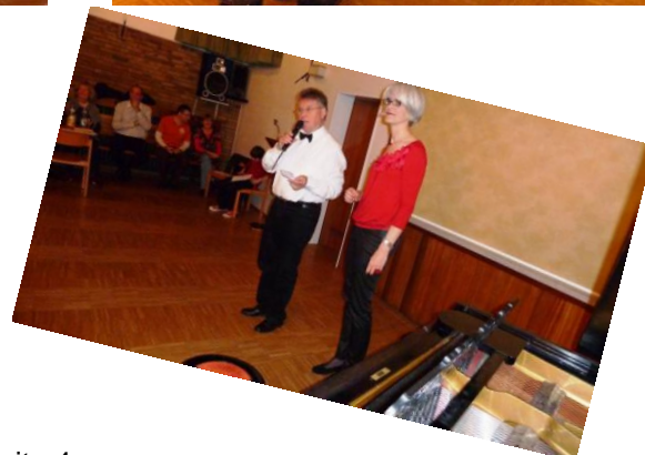
Text und Bilder: Werner Möltgen